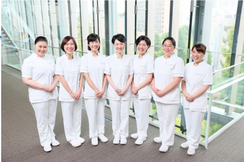
聖路加国際病院看護部ウェブサイト http://hospitaabout/feature.html