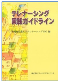
聖路加看護大学テレナーシングSIG編 テレナーシング実践ガイドライン (株)ワールドプランニング,2013. (ISBN 978-4-86351-059-3) (定価2,000円+税)